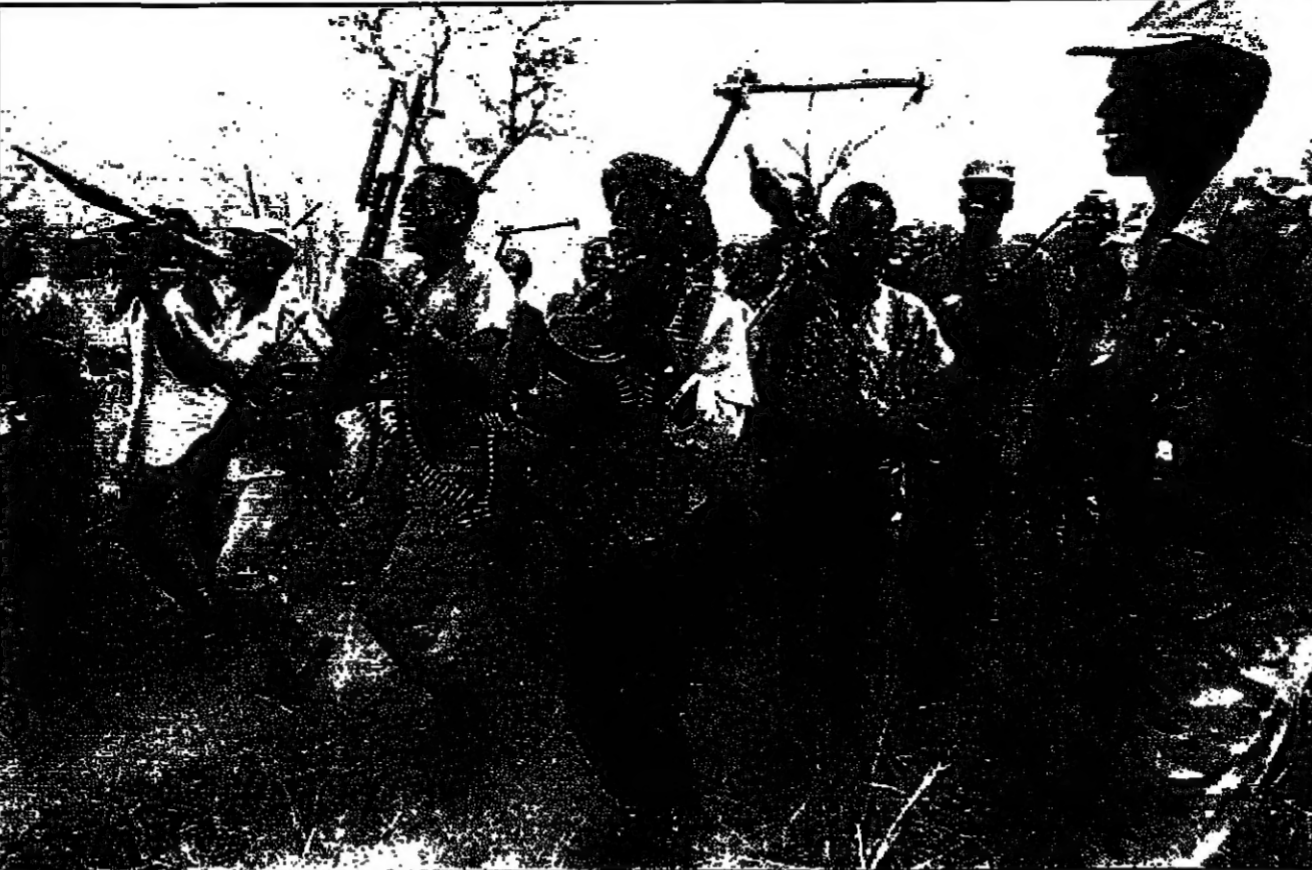
محترون سودانيين تابعين لجيش التحرير بقيادة جون فرنق (في الوسط)

الخرطوم - «القدس العربي»: الخرطوم - «القدس العربي»: الخرطوم - «القدس العربي»: الخرطوم - «القدس العربي»: الخرطوم - «القدس العربي»: